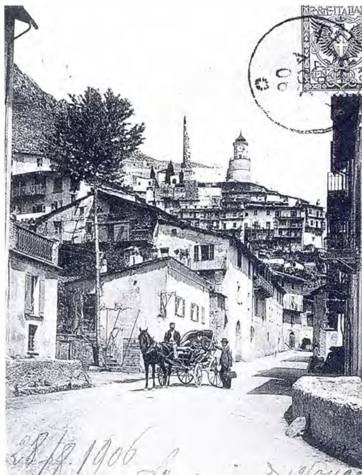
Sopra: Tenda con le rovine del castello dei Lascaris. Sotto: il paese in una cartolina di inizio Novecento.

vita, li confortasse, l'istruisse e con saggi consigli li mantenesse nella retta ed unica via della fede, si fanno premura di rivolgere caldissima preghiera alla S.V. Ill.ma, affinché, col-