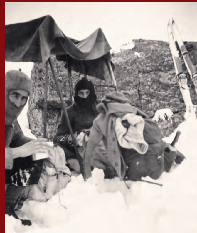
Nota: dal momento che non si conosce l'identità di tutte le persone ritratte nelle immagini pubblicate in queste pagine, si è scelto di riportare in didascalia solo i nomi di quelle identificate in modo completo e certo.